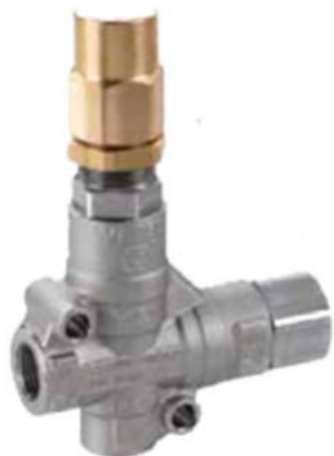
Código 4072000091 Descripción By-Pass VHP51, 550 BAR (8,000 PSI)