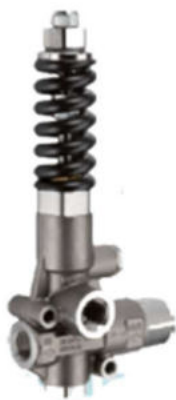
Código 4072201000 Descripción By-Pass VHP 70, 700 BAR (10,150 PSI)