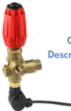
Código 4072000084 Descripción By-Pass VHP39, 390 BAR (5,600 PSI) 40 LPM Presostato